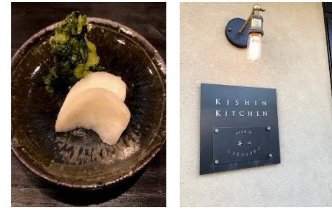
<京都 朝食喜心 お漬物>

予約を入れた時の対応が実に暖かく、、、 案の定、目の前で、土鍋でお米を炊き始める。そして、カウンターに色々な作家さんのお茶碗が、七、八器並べられ、お客は、自分の好みを選ぶ。ご飯が炊き上がると、客席に抑えた歓声が噴きこぼれる。まずは、煮えばなのアルデンテを一口。お米の本来の旨さを噛みしめる。暖かいご飯、、、 う～ん。暖かい具沢山の汁物、、、 う～ん。京都らしい生湯葉の小鉢、、、 う～ん。絶品の小さなウルメイワシ二本。背筋がピーンと伸びるお漬物。