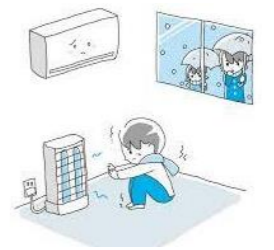
暖房しても暖まりにくい ( はい ・ いいえ )