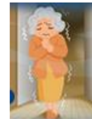
ローカが寒い ( はい ・ いいえ )