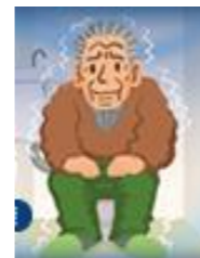
トイレが寒い ( はい ・ いいえ )