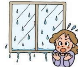
結露が目立つ 窓付近から寒さが伝わってくる ( はい ・ いいえ )

冬場の住まいが、このような状態になることはありませんか? 住まいの寒さ(寒暖差)は身体にとって、かなり負担がかかると言われています。 ガマンをされず、改善できそうな部分からでも見直してみてもいいかがですか? いろいろとご提案をさせていただきます。