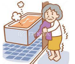
浴室や脱衣室が寒い ( はい ・ いいえ )