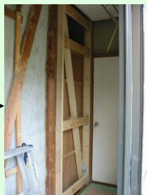
壁補強下地受けさん木取り付け