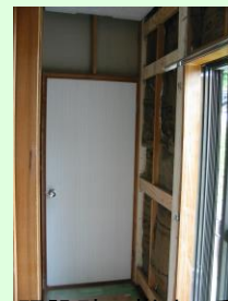
既設壁の撤去・受けさん木取り付け