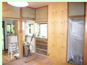
工事中：構造用合板貼り