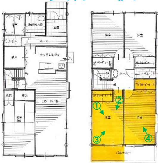
1階 リフォーム前 2階