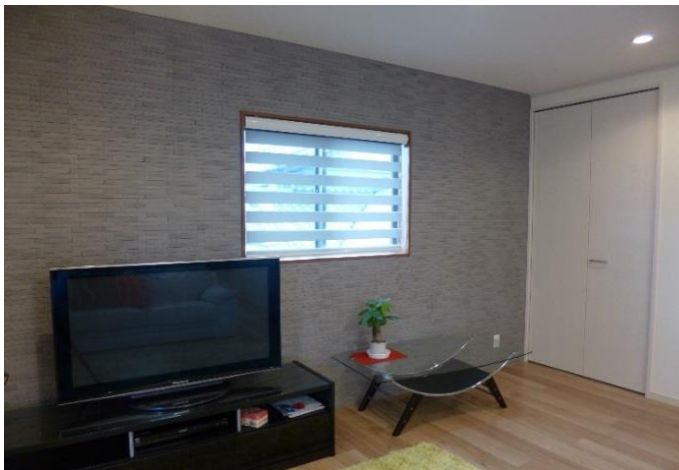
⑦リフォーム後 室内の湿気調整やイヤな臭いを低減し、室内の空気調整に役立つ多孔質のセラミックを貼りました。(エコカラット)