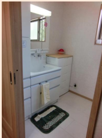
工事後 収納たっぷりの洗面台