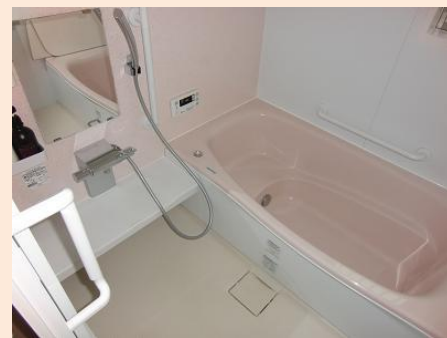
工事後 高断熱浴槽バスルーム