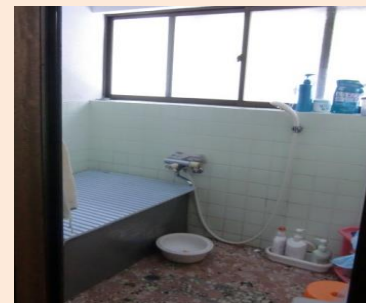
工事前 (浴室:タイル貼りで寒い浴室)