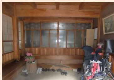
工事前 (ホール～和室戸)

和室を縮めてローカを新設 既設のガラス戸を再利用して 2本引き違い戸に改造しました。