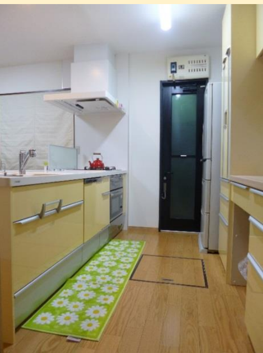
D リフォーム後 狭かったキッチンの通路 スペースを広げました。